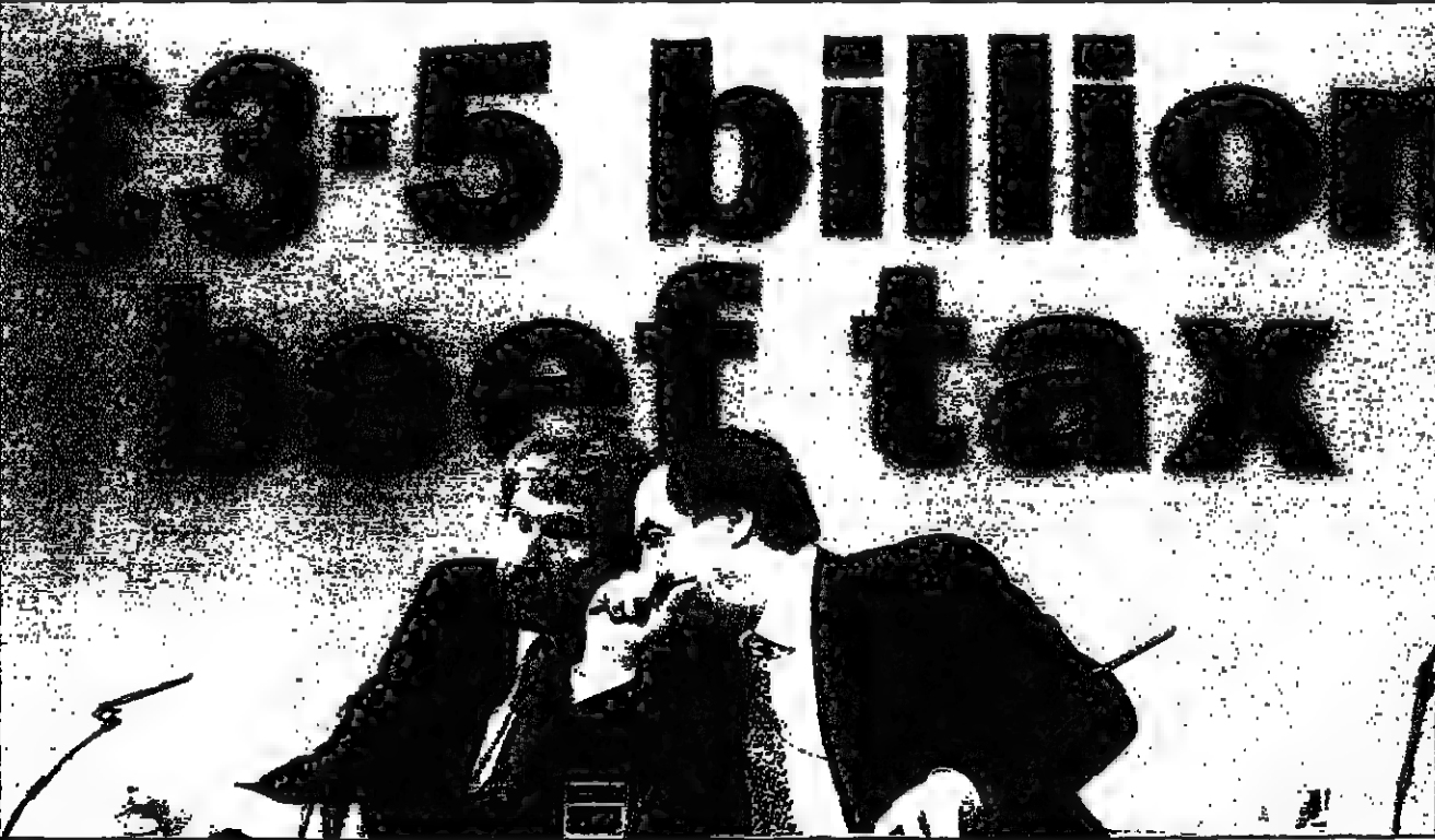
وزير الزراعة في حكومة لبل المالية بيوت مولي (يسار) وثالث زعيم حزب العمال جون بيسكوت يتحدثان في مؤتمر صحفي أمس في لندن ورواهما ملصق انتخابي للحزب كتب عليه ان سياسة الحكومة البريطانية تجاه موضوع مرض جنون البقر سيثبت خسائر البلاد قيمتها 3.5 مليار جنيه استرليني

بيروت - رويترز: قال بيان مكتب رجل الأعمال السعودي الأمير الوليد بن طلال أمس الاثنين أنه أصبح واحدا من كبار المساهمين في دار الاستثمار اللبنانية لبيانون انفسست بعد شراءه عمدا لم يصف عنه من أسهمها. وقال الوليد الذي ورد في رويترز بالخبر من البنك التجاري السعودي المسجل الذي يرأس الأمير الوليد مجلس إدارته ان الشراء يعكس رغبة الأمير في المساهمة في إعادة بناء لبنان وتنمية اقتصاده والمشاركة في المشاريع الحيوية التي تقوم بها لبيانون انفسست. ولم يوضح البيان عن تفاصيل أخرى وتحدث الاتصال بالباردير السعودي الذي يمتلك حصصا في مؤسسات